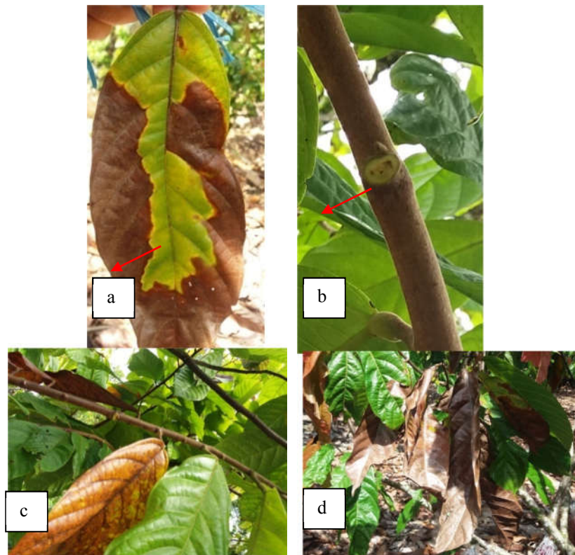
Gambar 3. Gejala penyakit VSD di perkebunan kakao: a. Permukaan daun berwarna kuning kecoklatan, b. Terdapat 3 noktah pada bekas duduk daun, c. Ranting ompong dan d. Ujung ranting kering.