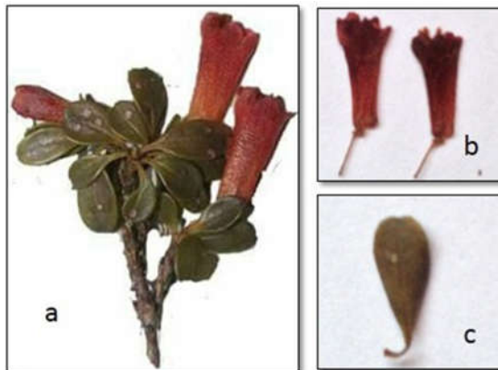
Gambar 1. Rhododendron quadrasianum S.vidal var. celebicum J.J.Sm: (a) Ranting dan perbungaan, (b) bunga, (c) daun