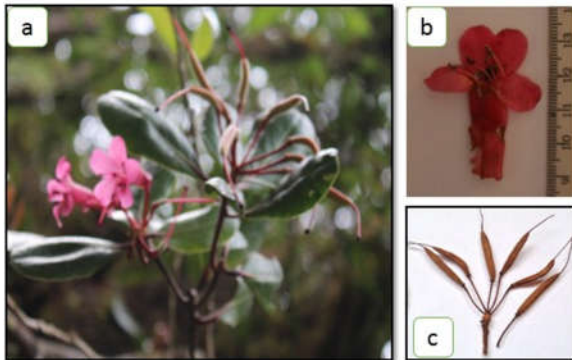
Gambar 4. Rhododendron celebicum (Blume) DC: (a) Ranting dan perbungaan, (b) bunga, (c) buah

Deskripsi: Semak, teresterial, 1-1,5 m. Batang bulat, permukaan kasar, berwarna coklat. Daun tunggal, berkarang, 5 tangkai, bentuk daun jorong, panjang 6 cm, lebar 3,5 cm, pangkal runcing, ujung tumpul, tepi rata, tangkai daun silinder, muda berwarna merah maron dan tua hijau kecoklatan, pertulangan menyirip, permukaan atas berkerut, bawah gundul, berwarna hijau tua. Perbungaan terminal, majemuk berbatas, terdiri atas 5-8 kuntum. Bunga terjumbai, pedisel 2,3-2,5 cm, berwarna merah; kelopak miring; mahkota berlekatan, berbentuk tabung, permukaan mengkilat, 2,7 cm, berwarna merah muda; benang sari 8-10, tertancap pada bagian dasar mahkota, tangkai sari berberkas banyak, berwarna merah