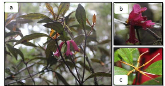
Gambar 2. Rhododendron malayanum Jack: (a) Ranting dan perbungaan, (b) bunga, (c) buah

permukaan mengkilat; benang sari 10 tertancap di dasar mahkota; tangkai sari berberkas banyak, 2,3-2,5 cm, berwarna merah muda; kepala sari tegak, berwarna coklat tua; putik 1, bakal buah menumpang. Buah kapsul, coklat, 6 buah.