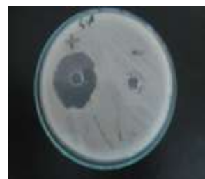
Gambar 4. Kontrol positif dan negatif