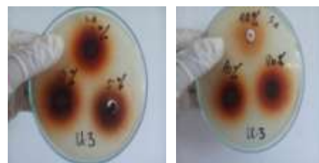
Gambar 3. Zona hambat ekstrak kulit bawang merah terhadap Staphylococcus aureus Perlakuan III