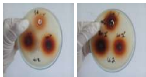
Gambar 2. Zona hambat ekstrak kulit bawang merah terhadap Staphylococcus aureus Perlakuan II