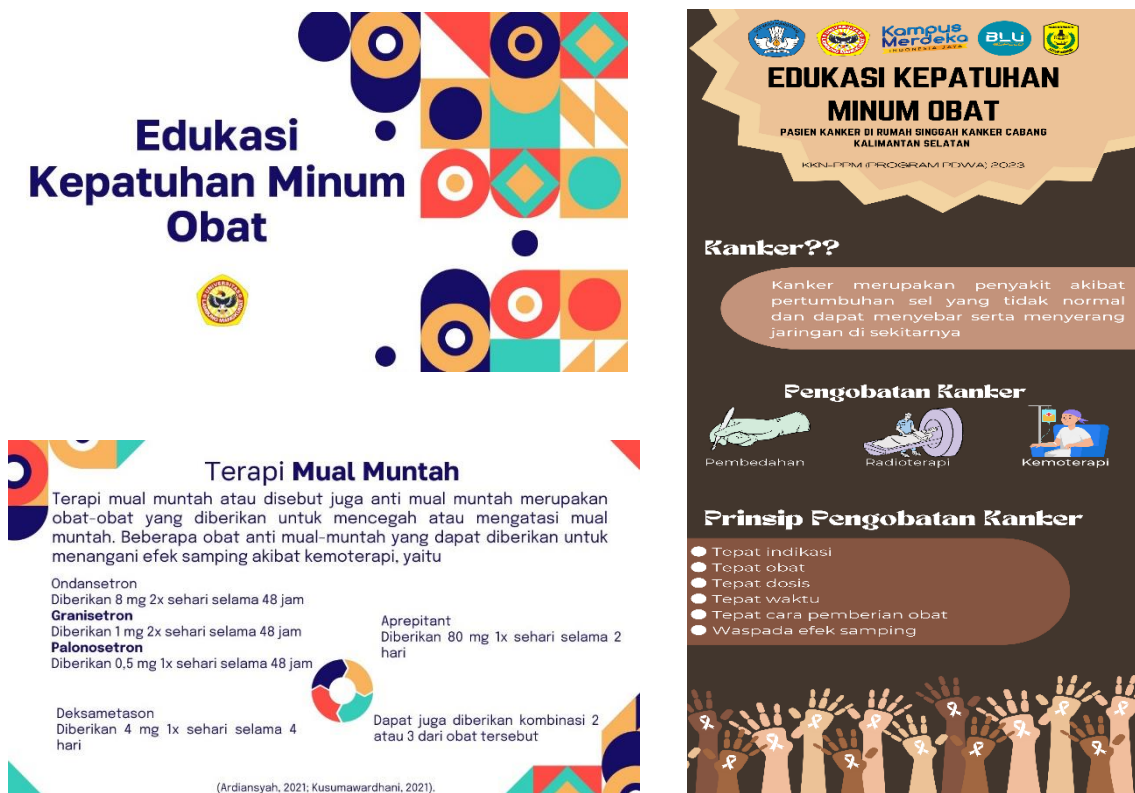
Gambar 1. Tampilan Media Bantu Penyuluhan Power Point dan X-Banner

Sebanyak 10 peserta ikut serta dalam kegiatan pengabdian. Acara dibuka dengan perkenalan diri dan penyampaian tujuan kegiatan. Kemudian dilakukan penyuluhan secara tatap muka langsung dengan menjelaskan materi dengan media bantu power point dan x-banner. Pengabdian dilanjutkan dengan sesi diskusi dimana terdapat beberapa orang peserta yang mengajukan pertanyaan seputar materi dan pemateri menyampaikan jawaban atas pernyataan yang diajukan. Tahapan akhir dari kegiatan adalah pengisian kuesioner dengan tujuan untuk mengukur pemahaman peserta terkait materi yang telah disampaikan.