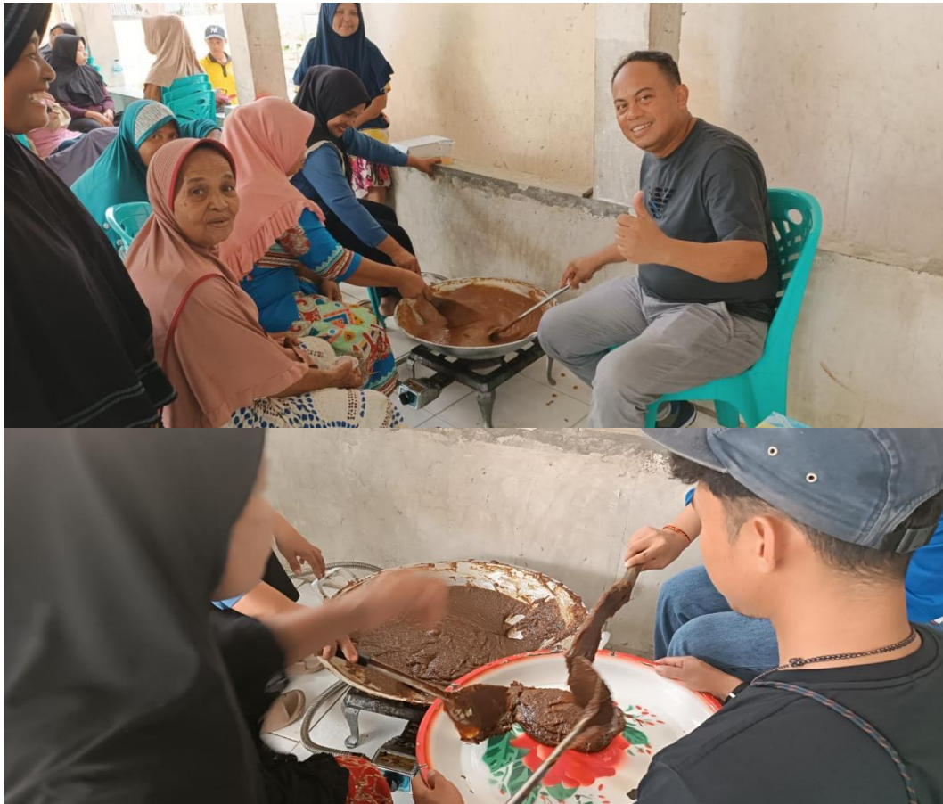
Gambar 2. Proses Pembuatan Dodol Pala