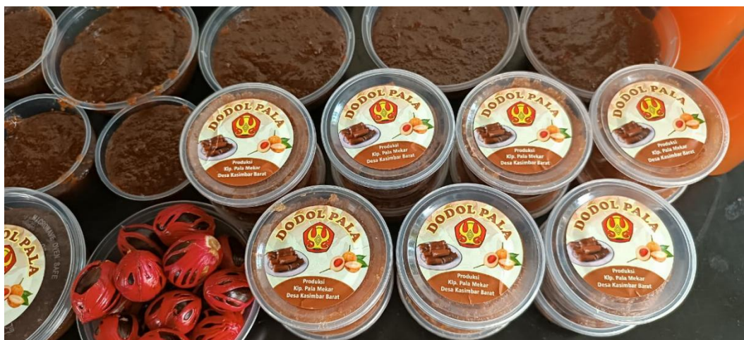
Gambar 3. Pengemasan Dodol Pala