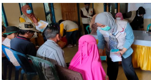
Gambar 1. Proses Penyampaian Materi dengan Media Leaflet

Edukasi melalui media leaflet digunakan dalam kegiatan ini, dimana didalamnya terdapat informasi terkait cara pengelolaan obat rusak dan kedaluwarsa, sehingga dapat memberikan penambahan pengetahuan, kemampuan individu masyarakat untuk mengubah atau mempengaruhi perilaku masyarakat baik secara individu atau kelompok dalam meningkatkan kesadaran akan nilai bahaya yang dapat ditimbulkan jika obat yang rusak dan kedaluwarsa tidak dikelola dengan baik, serta dapat mengubah perilaku masyarakat menjadi peduli akan dampak yang bias ditimbulkan oleh limbah obat-obatan pada lingkungan tempat tinggal. Menurut penelitian yang dilakukan oleh Azhari et al (2023) terdapat pengaruh edukasi melalui media leaflet terhadap pengetahuan kecakapan hidup kesehatan reproduksi. Sehingga sangat relevan dalam kegiatan pengabdian ini menggunakan media leaflet sebagai alternatif untuk memberikan edukasi kepada masyarakat. Pelaksanaan kegiatan tersebut dapat dilihat pada gambar 1,2 dan 3.