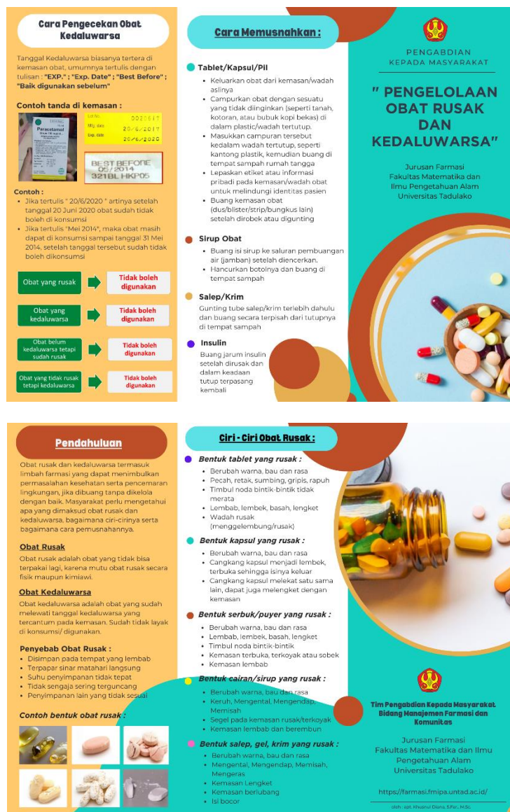
Gambar 4. Leaflet/Media Edukasi Pengelolaan Obat Rusak dan Kedaluwarsa

Berikut media leaflet yang dibagikan kepada peserta kegiatan pengabdian kepada Masyarakat Desa Uenuni, seperti terlihat pada gambar 4.