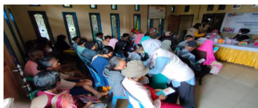
Gambar 2. Proses Pemberian Materi dengan Media Leaflet

Pada akhir pelaksanaan kegiatan, untuk mengevaluasi keberhasilan dari kegiatan tersebut dilakukan sesi diskusi berupa pertanyaan/ mini kuis. Adapun bentuk pertanyaan yang diberikan berupa bentuk ciri-ciri obat rusak, cara membaca tanggal kedaluwarsa obat, cara memusnahkan obat sediaan tablet jika sudah tidak digunakan. Dalam diskusi tersebut, diperoleh informasi bahwa pada dasarnya para peserta sudah mengetahui dari ciri-ciri obat yang rusak, akan tetapi masih kurang memahami cara memusnahkan obat yang tidak digunakan berdasarkan bentuk sediaan. Setelah diberikan penyuluhan dengan mendengar serta melihat kemampuan menjawab para peserta atas pertanyaan yang diberikan. Oleh karena itu selanjutnya kegiatan edukasi masyarakat tentang cara pembuangan obat yang tidak terpakai dapat dilakukan secara terjadwal kepada masyarakat. Dalam hal ini tenaga kesehatan di sarana pelayanan kesehatan bertanggung jawab untuk mengedukasi dan pemerintah harus memberikan program tentang pembuangan obat yang benar dilingkungan masyarakat berupa workshop cara pemusnahan obat yang tidak digunakan.