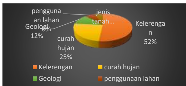
Gambar 2 Grafik bobot faktor penyebab bahaya longsor di Kecamatan Kulawi

Untuk mengetahui tingkat konsistensi dari bobot yang dihasilkan dilakukan dengan menghitung nilai konsistensi indeks dan konsistensi rasio dengan menggunakan Persamaan 1 dan Persamaan 2. Nilai konsistensi indeks yang dihasilkan pada wilayah Kecamatan Kulawi yaitu 0,08 dan nilai konsistensi rasio pada wilayah Kecamatan Kulawi yaitu 6,86%. Nilai ini menunjukkan bahwa nilai bobot yang didapatkan dalam metode ini dianggap konsisten karena memenuhi prinsip AHP dimana konsistensi rasio harus kurang dari 10%. Hasil perhitungan nilai indeks kompetensi dan kompetensi rasio ini dapat dilihat pada Gambar 2.