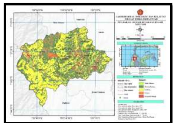
Gambar 5 Peta bahaya longsor di Kecamatan Kulawi

Penentuan Lokasi Berpotensi Longsor Dengan Menggunakan Metode Analytical Hierarchy Process (AHP) Di Kecamatan Kulawi Kabupaten Sigi (Maliki Lasera)