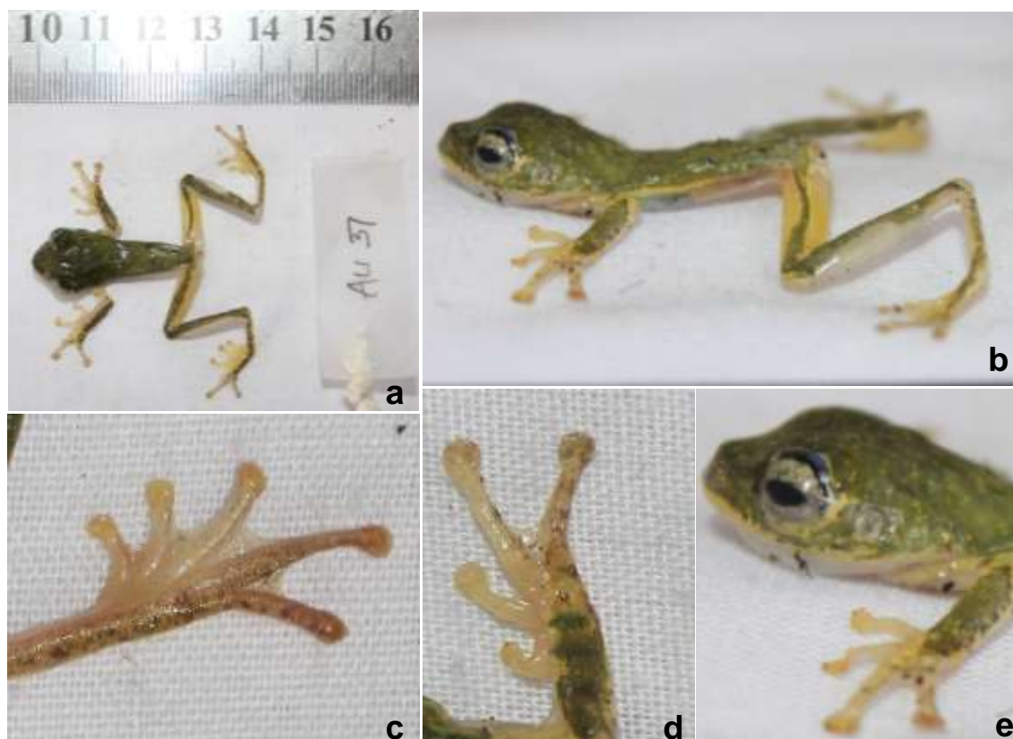
Gambar 2. Morfologi Rhacophorus edentulus . a. bagian dorsal; b. sisi ventral; c. selaput pada tungkai belakang; d. selaput pada tungkai depan; e. sisi ventral kepala

Gigi vomerin tereduksi menjadi sangat kecil; moncong membulat; loreal region sedikit cekung; nostril lebih dekat dengan